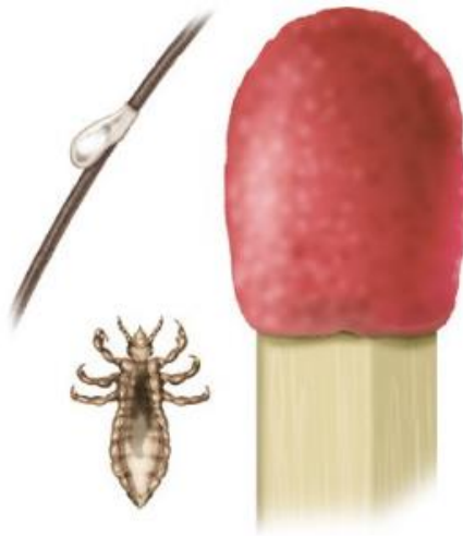
Kleiner als ein Streichholzkopf: ausgewachsene Kopflaus und Nisse

Ihre Eier (Nissen) legen Kopfläuse meist im Nacken oder hinter den Ohren ab. Sie kleben fest an den Haaransätzen, meist mit einem Abstand von höchstens einem Zentimeter zur Kopfhaut.